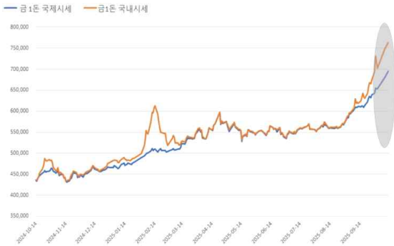
최근 국내·국제 금 시세 현황