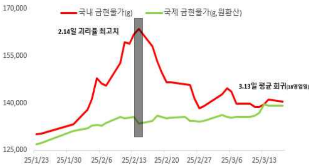
'25.2월중 국내·국제 금현물 가격 변화 추이